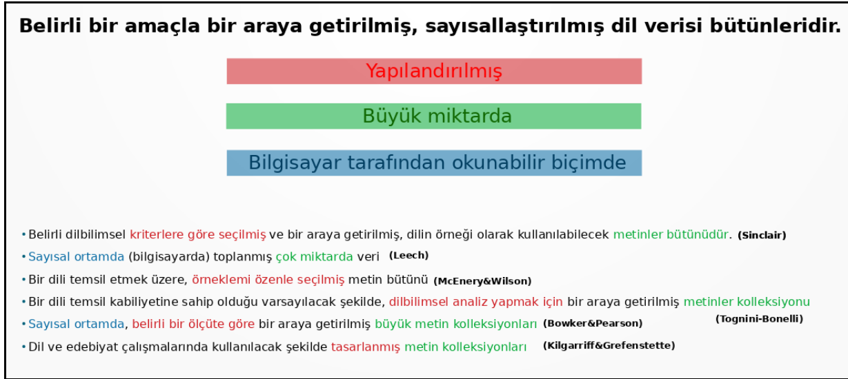
Resim 1 Derlem tanımlarındaki ortak özellikler (Sezer ve Sezer 2020: s.19)

Tanımların ortak vurguları değerlendirildiğinde (Resim 1) derlemlerin “belirli bir amaçla bir araya getirilmiş, sayısallaştırılmış, büyük hacimli dil verisi bütünlüğü” olduğu ifade edilebilir.