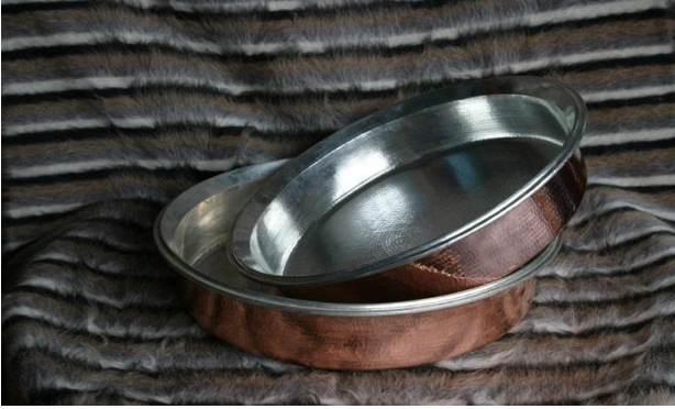
Resim 1. Çiğköfte Leğeni