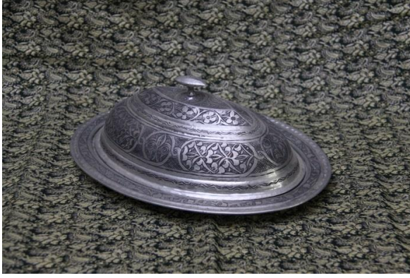
Resim 6. Kebap ve pilav tabađı