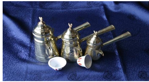
Resim 11. Mirra seti - 2