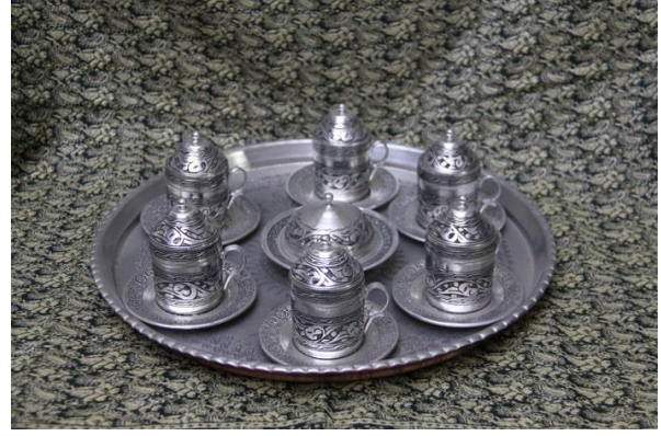
Resim 7. Altılı fincan seti