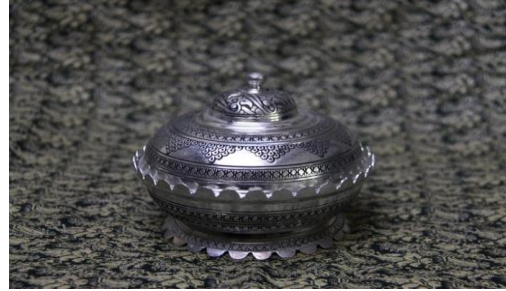
Resim 9. Şeker sunum kabı