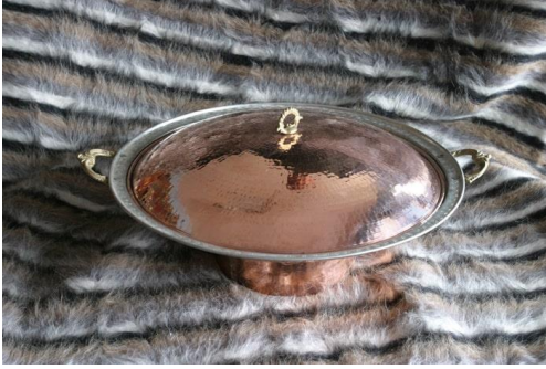
Resim 2. Lenger