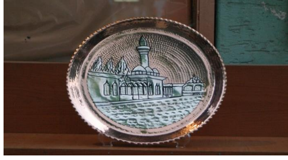
Resim 13. Balıklıgöl figürlü süs levhası