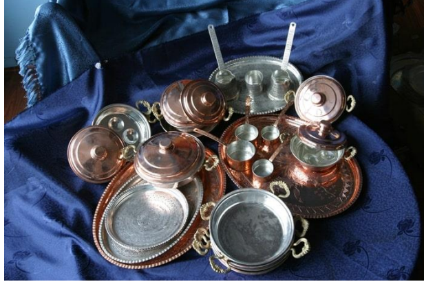
Resim 5. Çeşitli mutfak eşyaları

zor bir iş olduğunu vurgulayan Ömer Usta, her bir santimetre kareye yaklaşık 3 bin çekiç darbesinin vurulduğunu söylemektedir. Çekiççi ustaların elinden çıkan bakır eşya süslenmek için nakışçıya gönderilmektedir. Kabartma, kesme, oyma ve kaplama teknikleri ile süsleme işlemi tamamlanmaktadır (Bakır, Sözlü görüşme, 10.06.2022).