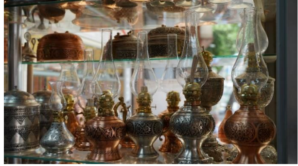
Resim 3. Lenger

Bakır ustalarının çözüm ortakları kalaycılar, çekiççiler ve nakışçılardır. Turistik ve hediyelik eşyaların siparişlerinde yoğunluk yaşandığından işleri yaparken destek almak gerekmektedir. Bir bakır ustası bakır plakaları yapacağı ürüne göre şekillendirir ve plakanın istenilen inceliğe gelebilmesi için çekiçi devreye girer. Ardından nakış işlenir. Son olarak kalaylama işlemi ile bakır ürün ortaya çıkar. Bu işlemlerin bir usta tarafından yapılması da mümkündür ancak Ömer Bakır, turistik bakır eşya siparişlerinin yoğun olduğu dönemlerde çekiççiler, nakışçılar ve kalaycılardan destek almaktadır (Bakır, Sözlü görüşme, 10.06.2022).