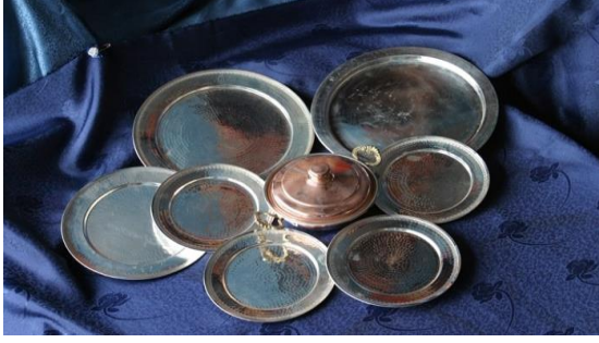
Resim 12. Kadayıf tepsileri