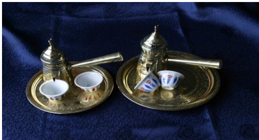
Resim 10. Mirra seti - 1