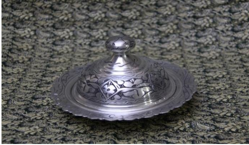
Resim 8. Lokum sunum kabı

Geleneksel bakır eşyalardan gümgüm, acı kahvenin kaynatılmasında, cezveler ise sunumunda kullanılmaktadır. Lenger denilen mutfak eşyası genel olarak kebab ve pilav sunumunda kullanılmaktadır. Kollu tas, pekmez ve bulgur gibi gıdaların kaynatılması esnasında kullanılır. Bakır sürahiler su, ayran ve şerbet sunumunda kullanılmaktadır. Teş adı verilen leđen türü ise genellikle çamaşır yıkamada ya da hamur yođurmada kullanılan büyük bir leđendir. Çiđköfte leđeninın Şanlıurfa için önemli ve özel bir yeri vardır, Şanlıurfalıları göre çiđköfte mutlaka bakır leđe yođurulmalıdır. Bakır leđe yođurulan çiđköftenin kıvamında ve daha lezzetli olduđu düşünölmektedir (Bakır, Sözlü görüşme, 10.06.2022).