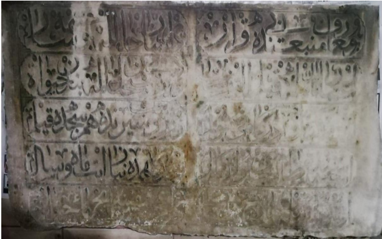
Şekil 1. Dağ Medresesi Çeşme Kitabesi